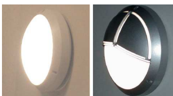
Casquette en variante