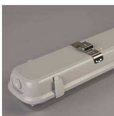
Clips de fixation de vasque polycarbonate Polycarbonate cover securing clips