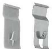
Polycarbonate - inox