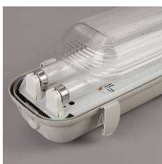
Étrier de fixation en inox Stainless steel fixing stirrup

N°TVA intracommunautaire FR 68 333 074 38