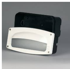
Casquette anti-éblouissement en option Anti-glare cover on option