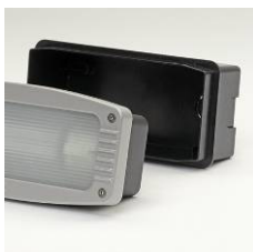
Livré avec pot d'encastrement Supplied with base