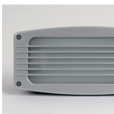
Grille de protection en option Protective grid on option